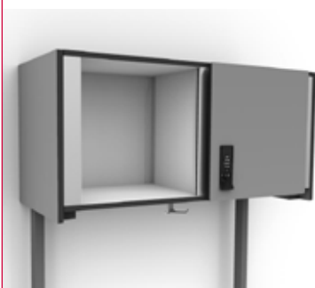
Type BK.od : openvak en kast met afsluitbare draaideur