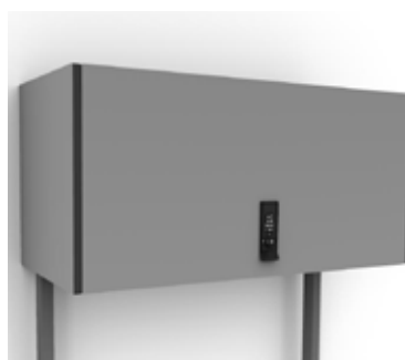
Type BK.k : Opbergkast met afsluitbare klepdeur